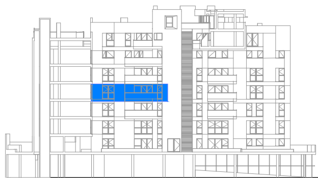
ALZADO PATIO BLOQUE 3